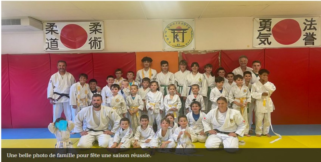
Une belle photo de famille pour fête une saison réussie.