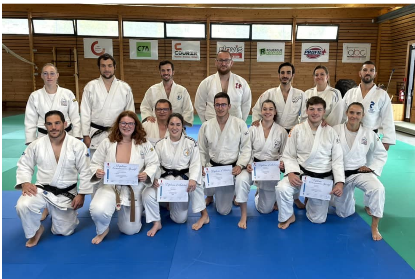
Au premier rang, les promus....