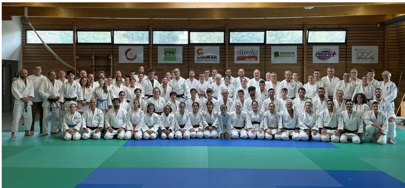
Le groupe de cette journée dédiée à l'arbitrage